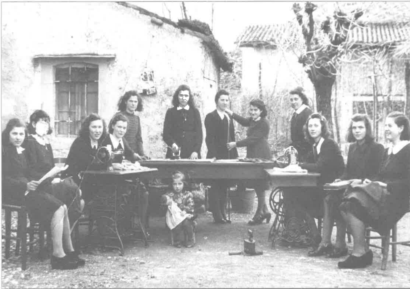
La sarta insegna il mestiere alle giovani del paese. Le sartorie a insegne il mistîr a les fantatis dal paîs.