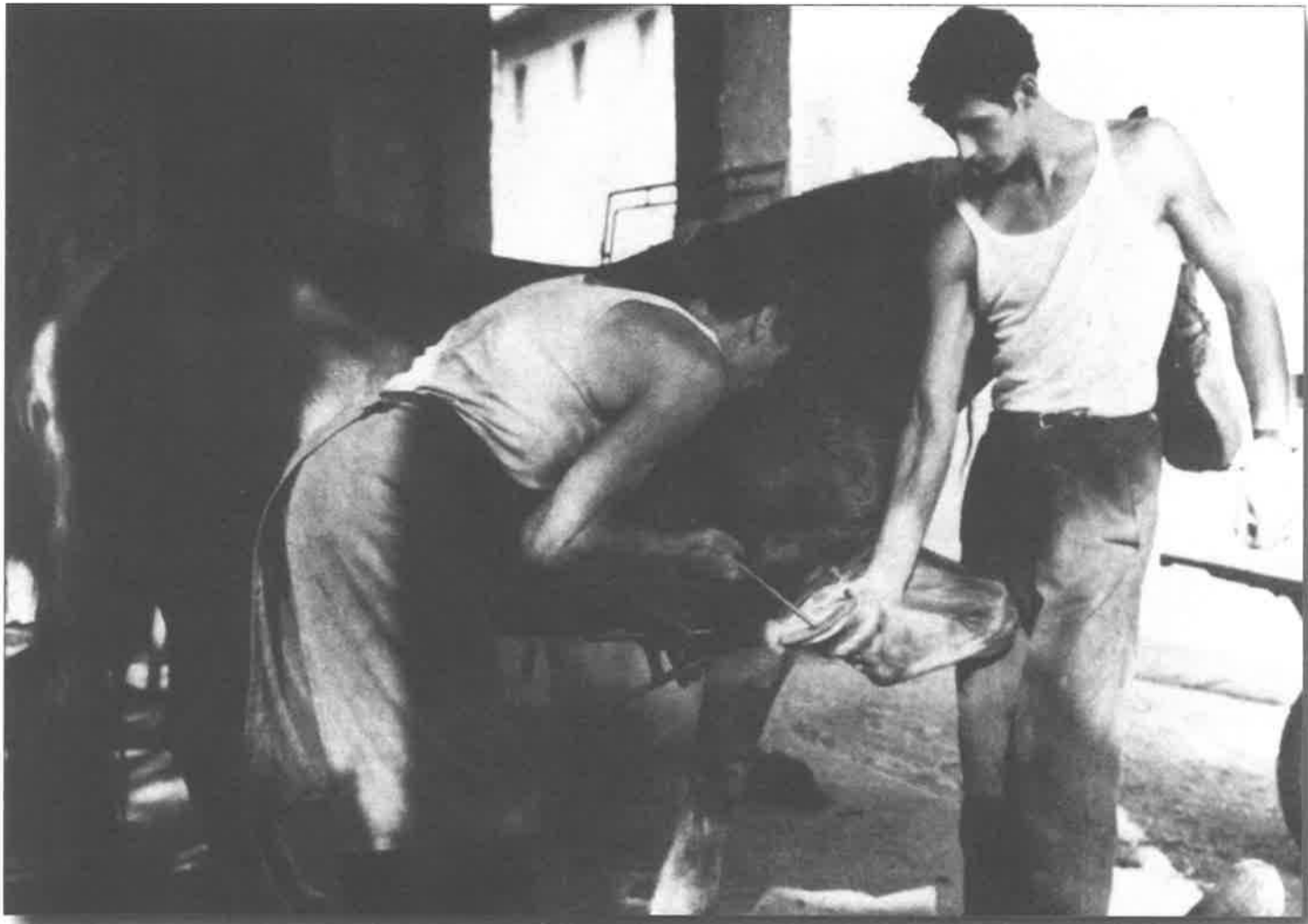
Il maniscalco sta ferrando un cavallo con forza e destrezza. Il marescalc al sta inferand un chjaval cun fuarze e destrezze.