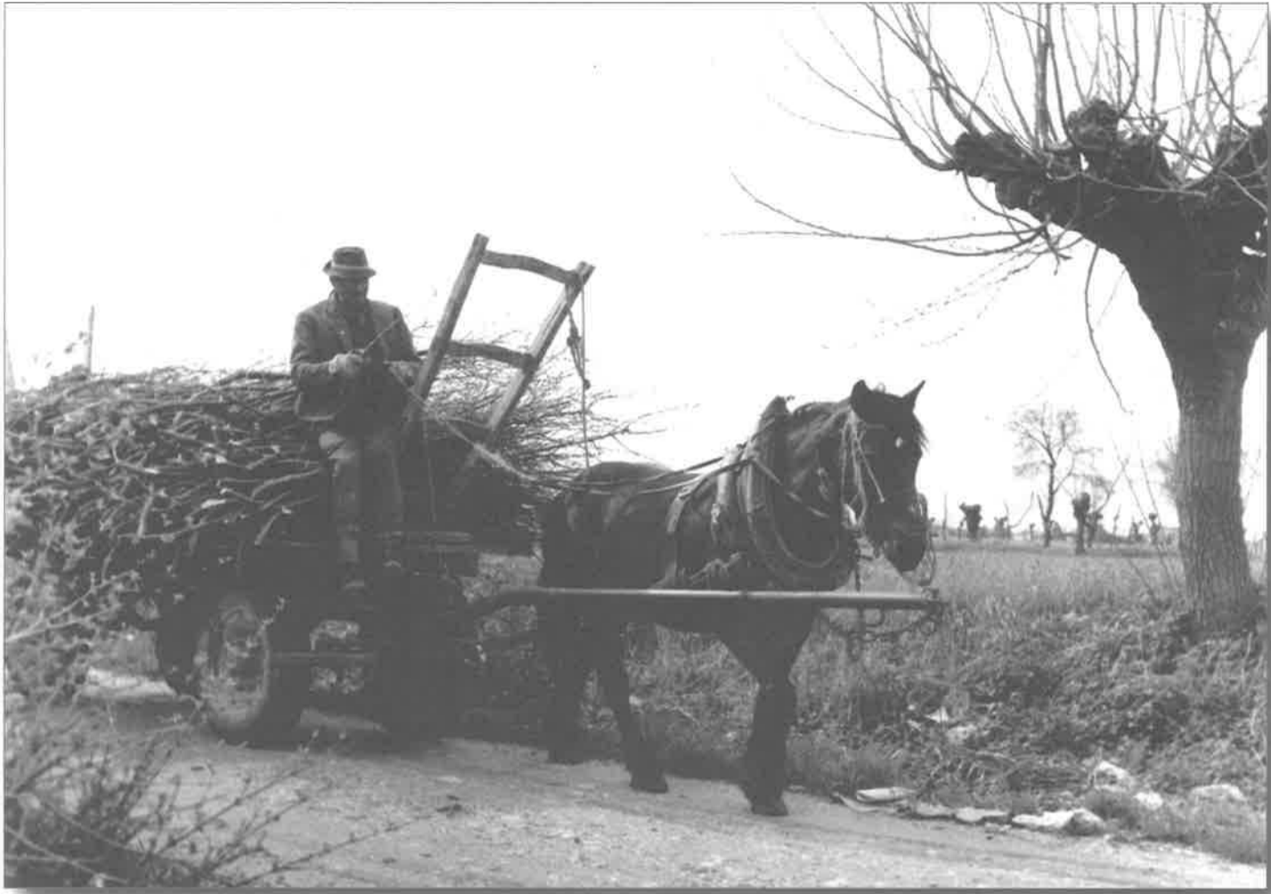
Il contadino con il carro porta a casa la legna. Il contadin cun le carete al puarte a chjase i lens.