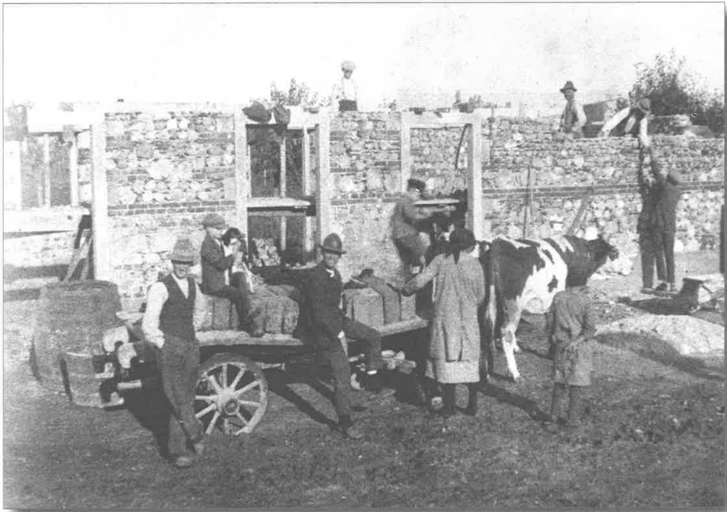
Il muratore e i suoi amici lavorano alla costruzione della casa. Il muradôr e i soi amîs a lavorin a la costruzion de chjase.